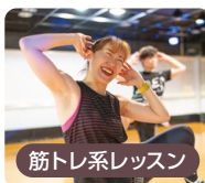
筋トレ系レッスン