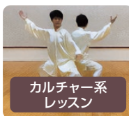
カルチャー系レッスン