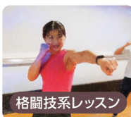
格闘技系レッスン